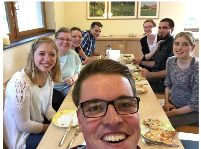
JuHus beim Kochen