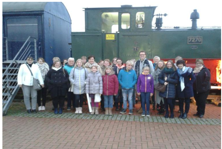
Herzkrankte Kinder e.V. beim „Starlight Express“ in Bochum

In der heutigen Ausgabe geht es um das gesunde Herz.